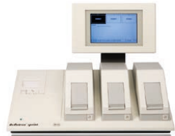
Système Reflotron® sprint

Pour un diagnostic en présence du patient ciblé avec un système Reflotron® de votre choix