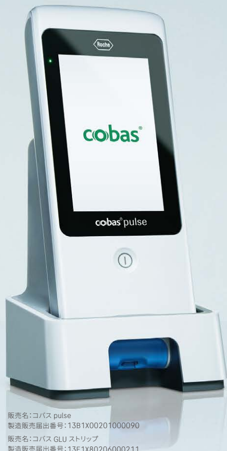
販売名:コバス pulse 製造販売届出番号:13B1X00201000090 販売名:コバス GLU ストリップ 製造販売届出番号:13E1X80206000211

FDA2、CLSI POCT12-A33のガイドラインに沿った高い分析基準を満たす先進的な分析性能と、スマートフォンのように直感的に使用できるAndroidソフトウェアを搭載し簡便操作を両立。Wi-Fi接続や多彩なアプリのダウンロードが可能なデジタル機能が向上。POCT対応機器一元データ管理システム「コバス infinity POC solution」と組み合わせて使用することにより医療現場のワークフローを改善する次世代の血糖測定システムです。