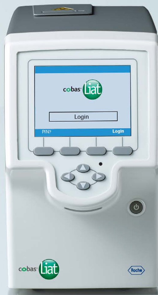
販売名:コバス Liat 製造販売届出番号:13B1X00201000067 販売名:コバス Liat SARS-CoV-2 & Flu A/B 製造販売承認番号:30300EZK00025000