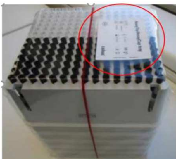
Изображение 1: Комплект аналитических пробирок и одноразовых наконечников AssayTip / AssayCup с внешней этикеткой.

Внешняя этикетка размещается непосредственно на упаковочной пленке комплекта AssayTip / AssayCup.